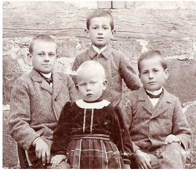
Die Kinder ohne Ewald

Adam und Dorothee hatten die folgenden Kinder: